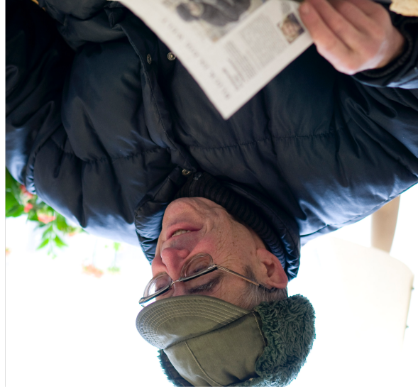
Zeitungsleser in der Tagesstätte der Wohnungslosenhilfe

„Der Mensch hat nicht Wert, der Mensch hat Würde“