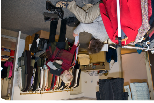
Kleiderausgabe in der Kleiderkammer

Mit der persönlichen Unterstützung und Begleitung mit dem Ziel der Anbindung an die vorhandenen Hilfesysteme sollen alle Möglichkeiten genutzt werden, um die persönliche Situation der Menschen ohne Wohnung zu verbessern.